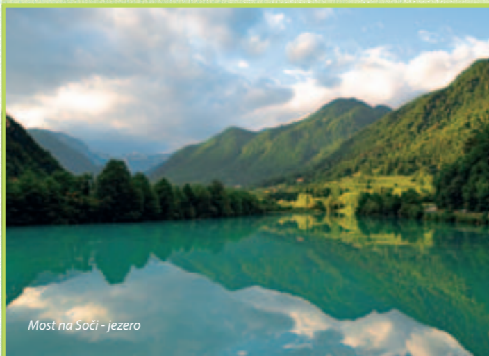
Most na Soči - jezero

KONTAKT: Dom Trenta, tel: +386 (0)5 388 93 30, +386 (0)41 759 089