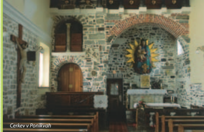
Cerkev v Ponikvah